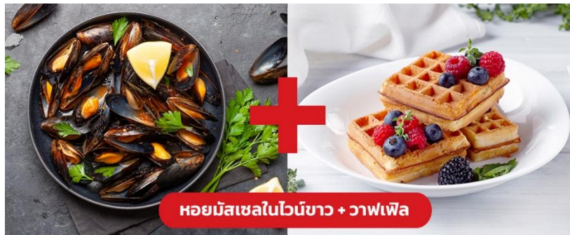
หอยมัสเซลในไวน์ขาว + วาฟเฟิล

🍴 รับประทานอาหารกลางวัน (มื้อที่10) เมนูพิเศษ!! หอยมัสเซล + วาฟเฟิล (Mussel in White wine + Waffle)